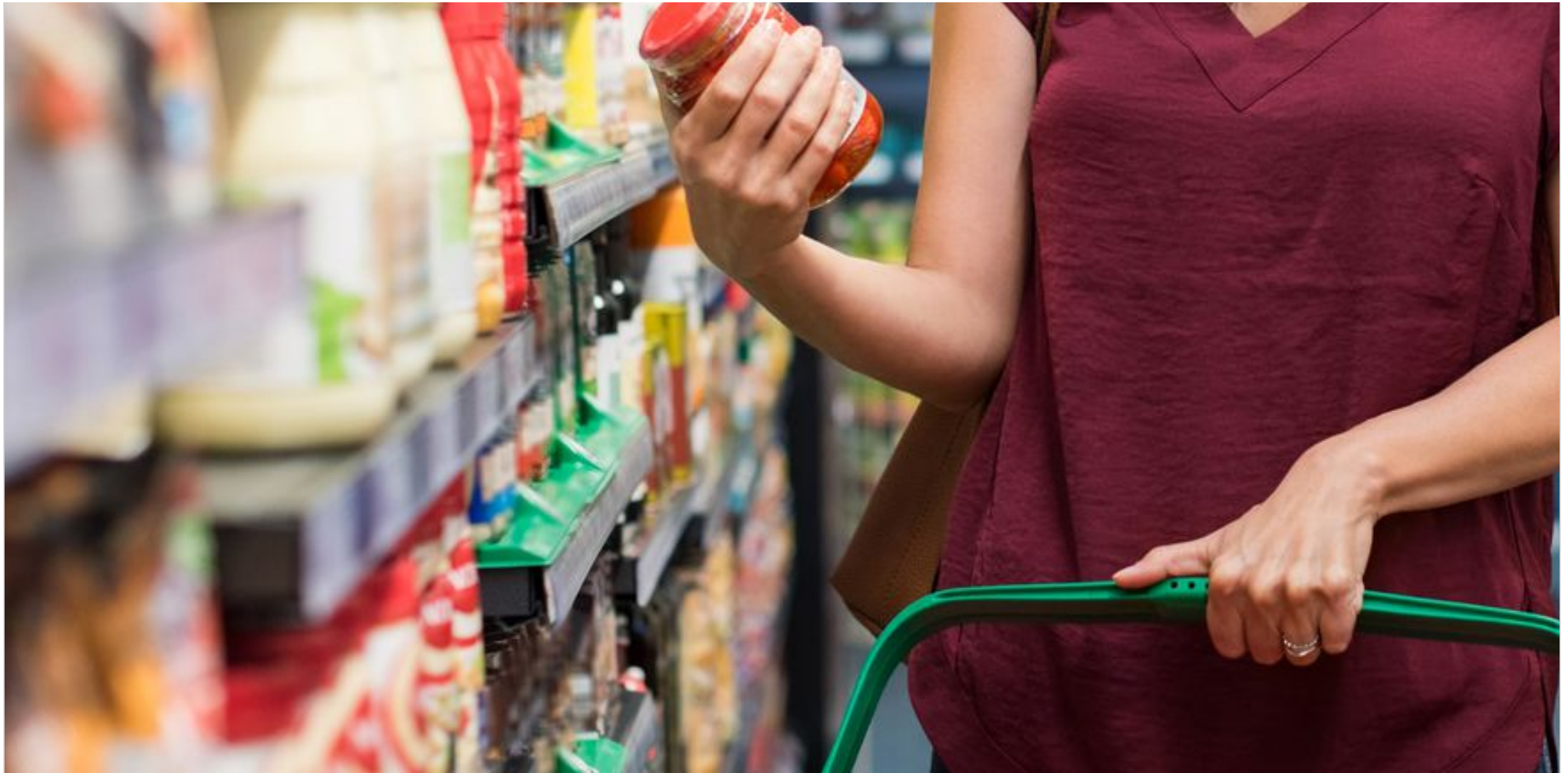
La iniciativa busca advertir sobre la composición nutricional de los productos